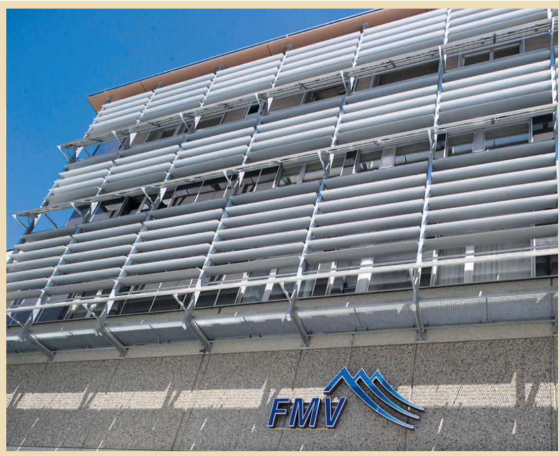
Der Sitz der Walliser Elektrizitätsgesellschaft FMV befindet sich in Sitten, in einem Gebäude, das mit Solarzellen bestückt ist.

Der Grosse Rat des Kantons Wallis überträgt 1990 der Walliser Elektrizitätsgesellschaft die Aufgabe der Interessenwahrung in der Wasserkraft und deren Verwaltung. Dies ist ein wichtiger Schritt, denn das Wasser und